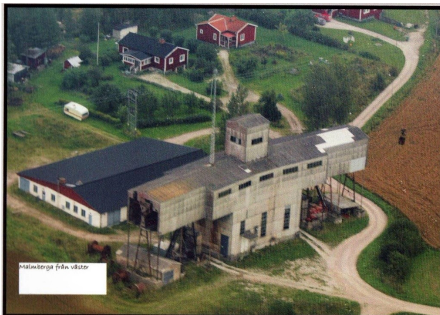
Kalklinbanans centralstation.

Linbanan byggdes under krigsåren 1939-1940 och invigdes 1941. Den utgjorde ett mycket resurssnålt och miljövänligt sätt att frakta kalk från kalkbrottet i Forsby till Skånska Cementaktiebolagets cementfabrik i Köping. Banan var då med sina 42 km världens längsta linbana, ungefär lika lång som ett maratonlopp. Den sträckte sig genom två län och fem kommuner. Från Österåker i Vingåkers kommun över Julitas jordbruks- och skogsmarker i Katrineholms kommun, till Öja och Västermo i Eskilstuna kommun. Därifrån sträckte den sig in i Kungsörs kommun via Granhammar, över E20, Arbogaån till Kungs Barkarö och Björskogs församling. Passerade sedan Hedströmmen vid gränsen till Köpings kommun för att nå cementfabriken där. Den hade sin storhetstid på 1960-talet under miljonprogrammet för bostadsbyggande. På 10 år skulle en miljon bostäder byggas. Då var det stor efterfrågan på cement och kalken var en viktig ingrediens. Senare minskade kalkbehovet varför banan ansågs företagsekonomiskt olönsam och togs ur bruk 1997. Sedan dess fraktas kalkstenen på lastbilar. Skånska Cementaktiebolaget, som lät bygga linbanan, bytte 1969 sitt namn till Cementa, 1973 till Euroc, 1990 såldes det till Partek Nordkalk och heter idag Nordkalk AB.